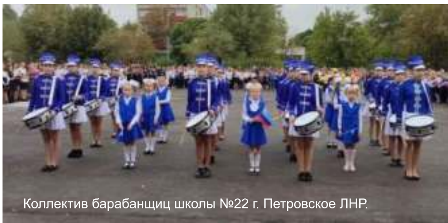
Коллектив барабанщиц школы №22 г. Петровское ЛНР.