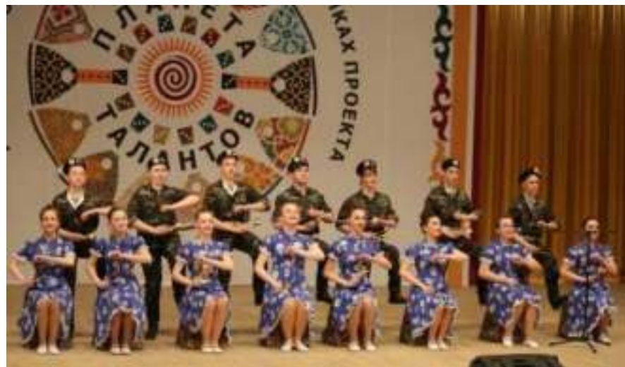
Образцовый ансамбль ложкарей «Бураевские самоцветы» с. Бураево.