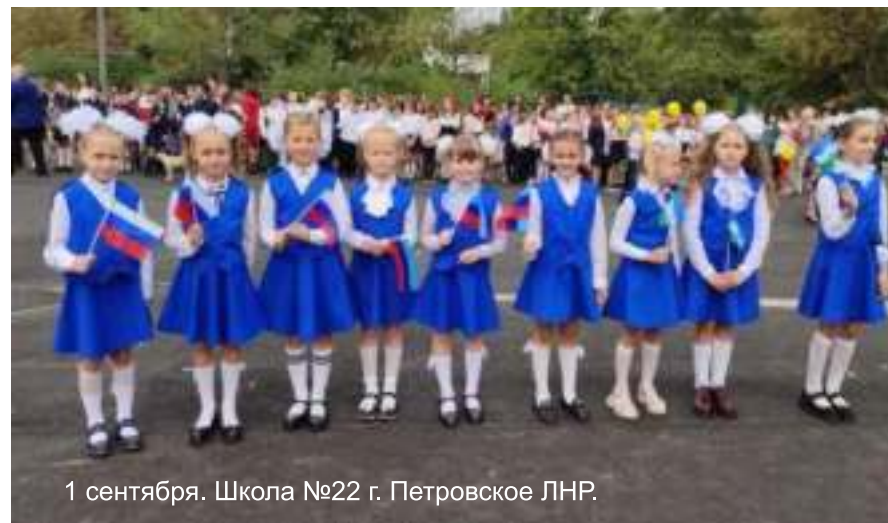
1 сентября. Школа №22 г. Петровское ЛНР.

Мы понимаем, насколько необходима поддержка школьников, подрастающего поколения и жителей региона находящегося в зоне боевых действий. Им жизненно важно ощущать духовную, культурную связь со всем народом огромной России, чувствовать нашу поддержку, знать что их не оставят одних в тяжелой ситуации. Даже, осознавая эту потребность, в ходе личного общения с коллегами из школы №22 г. Петровское, мы были удивлены с какой благодарностью, воодушевлением и готовностью поддержать наши начинания, были встречены