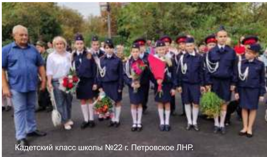
Кадетский класс школы №22 г. Петровское ЛНР.

Мы понимаем, насколько необходима поддержка школьников, подрастающего поколения и жителей региона находящегося в зоне боевых действий. Им жизненно важно ощущать духовную, культурную связь со всем народом огромной России, чувствовать нашу поддержку, знать что их не оставят одних в тяжелой ситуации. Даже, осознавая эту потребность, в ходе личного общения с коллегами из школы №22 г. Петровское, мы были удивлены с какой благодарностью, воодушевлением и готовностью поддержать наши начинания, были встречены